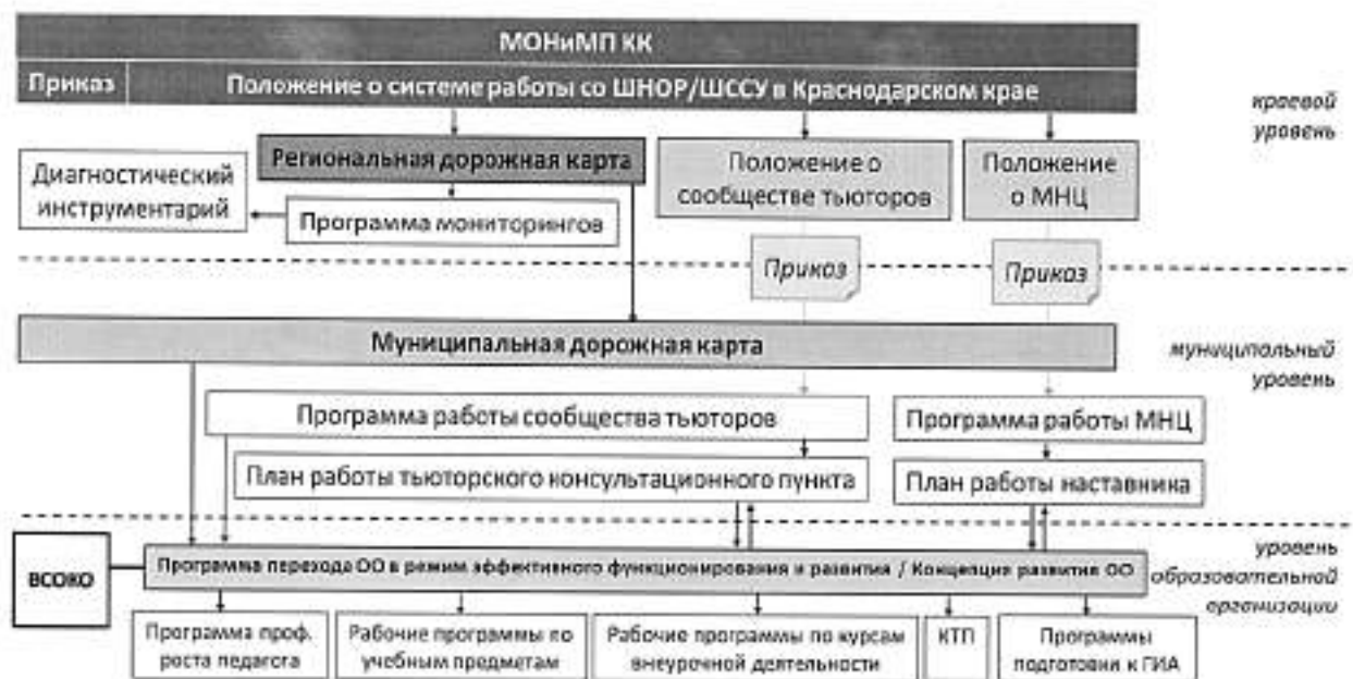
Рисунок 2 – Нормативная модель сопровождения школ с низкими образовательными результатами и/или школ, функционирующих в сложных социальных условиях в Краснодарском крае

Деятельность и взаимодействие субъектов краевой системы образования по сопровождению школ с низкими образовательными результатами и/или школ, функционирующих в сложных социальных условиях, осуществляется в рамках специально созданной нормативной базы. Документационное обеспечение реализации Системы в Краснодарском крае приведено на рисунке 2.